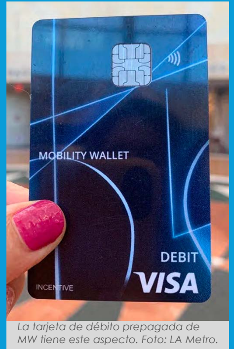
La tarjeta de débito prepagada de MW tiene este aspecto.

15 miembros de la Colaborativa Comunitaria de BSMLA participan en este programa piloto. Esto ha sido un recurso increíble para las familias que utilizan el transporte público como su principal medio de transporte para recibir servicios médicos prenatales, pediatras y de otros enfoques, para ir a la escuela, el trabajo, tiendas de comestibles y suministros, para comprar artículos para el hogar, visitar a la familia, y otras actividades familiares y comunitarias.