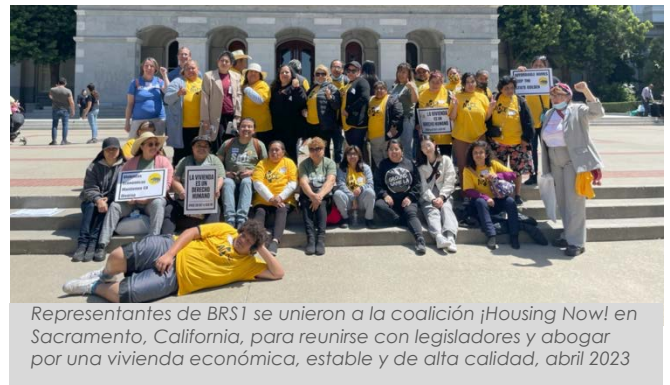
Representantes de BSR1 se unieron a la coalición ¡Housing Now! en Sacramento, California, para reunirse con legisladores y abogar por una vivienda económica, estable y de alta calidad, abril 2023

Para garantizar la inclusión equitativa de los miembros de la comunidad en todos los esfuerzos de equidad de vivienda y salud, recibimos fondos para compartir y ampliar nuestro modelo de transformación comunitaria. El año que viene, BSR1 apoyará la inclusión de miembros de la comunidad en la Colaborativa Para la Justicia de Vivienda Como Equidad de Salud