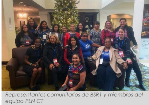
Representantes comunitarios de BSR1 y miembros del equipo PLN CT

En julio, asistimos a la Conferencia Anual UnidosUS 2023 en Chicago, Illinois, en donde pudimos compartir y aprovechar el desarrollo del liderazgo comunitario hacia estrategias de cambio de sistemas con otros líderes comunitarios y representantes públicos de todo el país.