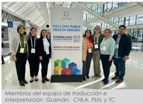
Miembros del equipo de traducción e interpretación Guzmán, CHLA, PLN, y TC

En noviembre, Representantes de BSR1 asistieron a la 21ª Conferencia Anual de Visión y Compromiso. Esta conferencia ofrece a los promotores, trabajadores y líderes de la salud comunitaria, la oportunidad de aprender, establecer contactos y celebrar el importante trabajo y las contribuciones que realizan en su comunidad.