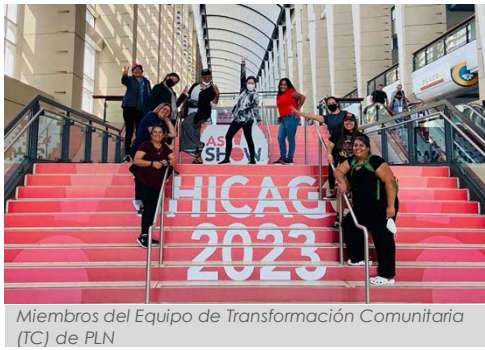
Miembros del Equipo de Transformación Comunitaria (TC) de PLN