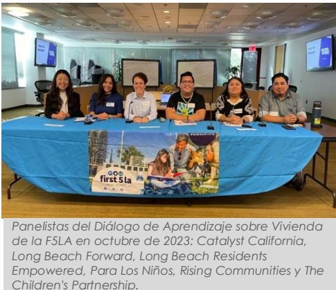
Panelistas del Diálogo de Aprendizaje sobre Vivienda de la F5LA en octubre de 2023: Catalyst California, Long Beach Forward, Long Beach Residents Empowered, Para Los Niños, Rising Communities y The Children's Partnership.

En noviembre, presentamos con CHLA nuestro trabajo de transformación de los sistemas de cuidado de salud en la Reunión y Exposición Anual 2023 de la Asociación Estadounidense de Salud Pública en Atlanta, Georgia. El equipo pudo hablar sobre cómo los Promotores Comunitarios, que trabajan en colaboración con CHLA, abordan las disparidades de salud de los pacientes y sus familias mediante el apoyo culturalmente afirmativo para superar las dificultades de acceso a cuidado de salud y presentar nuestra próxima publicación, el "Manual de transformación de los sistemas de cuidado de salud y marco de evaluación", que ayudará a las instituciones de cuidado de salud a adoptar nuestro modelo centrado en la equidad.